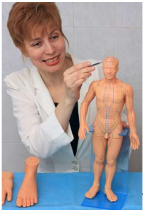
выявлять патологии и влиять на факторы риска заболеваний. Особое внимание уделять профилактике. Это во-первых.