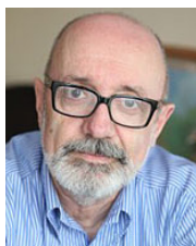
Лев Амбиндер, президент Русфонда, член Совета при Президенте РФ по развитию гражданского общества и правам человека

В 2013 году мы начали несколько принципиально новых для Русфонда системных программ, в их числе создание Петербургского регистра доноров костного мозга, навигатора по российским благотворительным фандрайзинговым фондам (Русфонд. Навигатор), рейтинга благотворительности в регионах России (Русфонд. Рейтинг). Первые результаты этих новых системных программ, как мы рассчитываем, появятся уже в 2014 году.