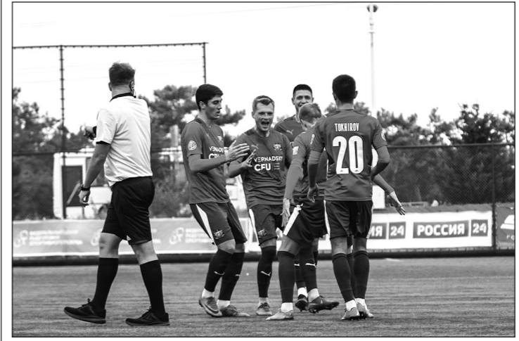
Сборная КФУ готовится к ударной осени. Очередной тур НСФЛ пройдёт в Санкт-Петербурге.

Очередной шаг к третьему подряд чемпионству в национальной студенческой футбольной лиге сборная КФУ делает в сентябре. Стал известен календарь осенней части турнира и доказывать своё превосходство крымчанам вновь предстоит на выезде. А борцы полуострова отлично проявили себя в открытых соревнованиях по вольной борьбе, которые завершились в Алуште.