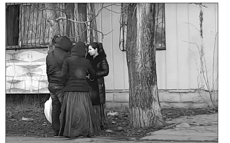
Цыгане в Симферополе орудуют в том числе рядом с жилыми домами.

Жители Ялты жалуются на цыган, которые то и дело совершают демарши по набережной курорта. Они предлагают рассказать всю правду и даже, чем сердце успокоится. Только далеко не все считают, что это признак цивилизованного курорта.