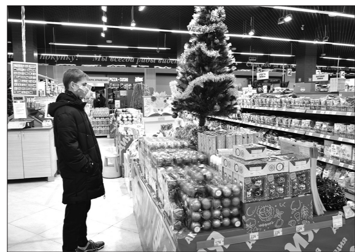
При покупке ёлочных игрушек не стоит руковоодствоваться лишь внешним видом.

Особое внимание обратите на то, защищены ли острые края стеклянной игрушки колпачком, проверьте, крепко ли держатся элементы крепления. Кстати, более крепкими являются блестящие стеклянные игрушки. Благодаря слою жидкого серебра, они прочнее матовых. Это уменьшит шанс пораниться об осколки разбитой игрушки.